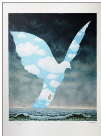
La Grande Famille - 1963