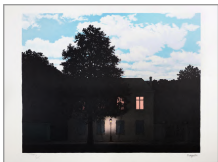
L'Empire des Lumières - 1961