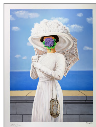
La Grande Guerre - 1964