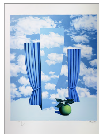
Le Beau Monde - 1962