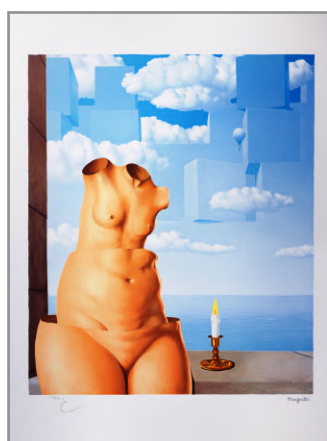
La Folie des Grandeurs II - 1948