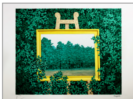
La Cascade - 1961