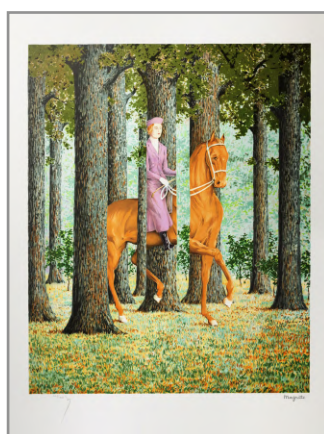
Le Blanc-Seing - 1965